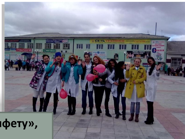
Акция «Меняем сигарету на конфету», п.Селенгинск, 2018 г.